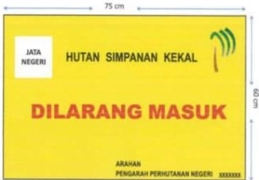
CONTOH PLET SEMPADAN HUTAN SIMPANAN KEKAL